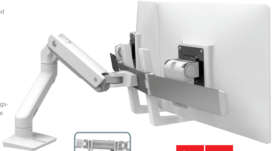
HX DUAL MONITORARM, TISCHHALTERUNG IN WEISS