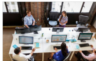
E230t Touch Monitor, V272 Monitor, Elite Display E240, P240va