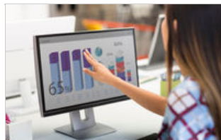
E230t Touch Monitor