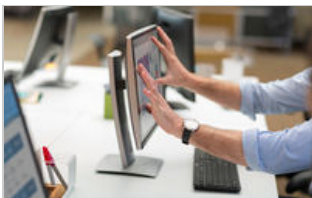
E230t Touch Monitor