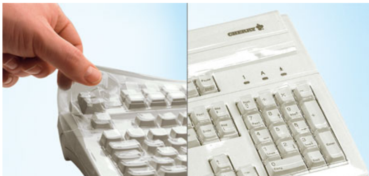
Ausführungsvarianten können von Produktabbildung abweichen