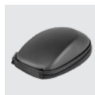
Transporttasche für CadMouse Wireless