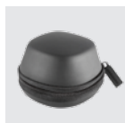
Transporttasche für SpaceMouse Wireless