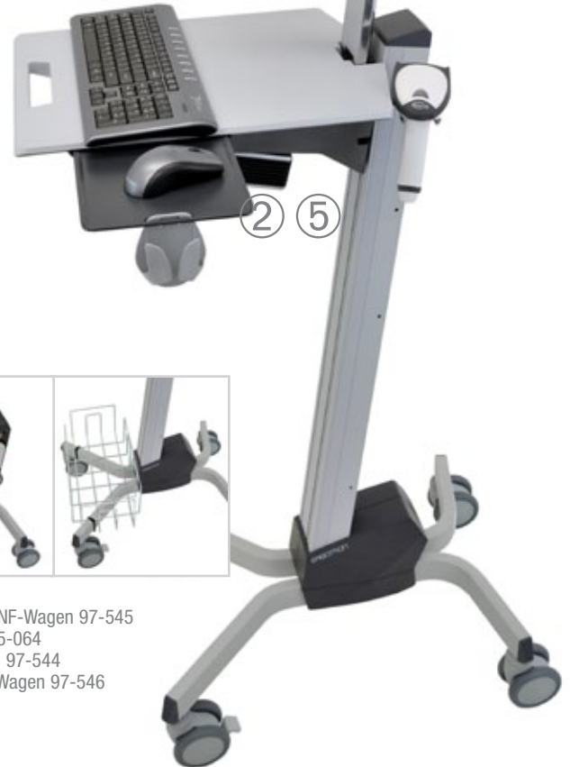
Laptop-Kit, vertikal, für NF-Wagen 97-546