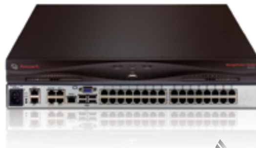
Avocent MergePoint Unity™-Switch (32 Ports)