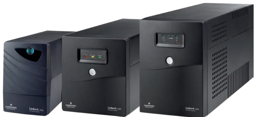
Liebert itON 600 VA