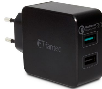
2x USB 30W QC3-A21 (Art.:1950) 1x Quick Charge 3.0 USB (3A) 1x USB (2,4A)